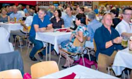
150 SVM-ler besuchten den Festabend