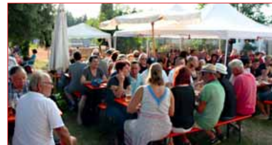
Gemütlicher Ausklang beim Waldfest

Jugendfußballturnieren, dem Stockschützenturnier, der Tennis Vereinsmeisterschaft, dem Waldfest-Lauf oder der Zumba-Tanzgruppe. Gemütlich bei gutem Essen und kühlen Getränken gingen die Festivitäten zum Vereinsjubiläum zu Ende ohne den Hinweis zu vergessen, die Ausstellung in der Gemeindehalle am Sonntagvor-