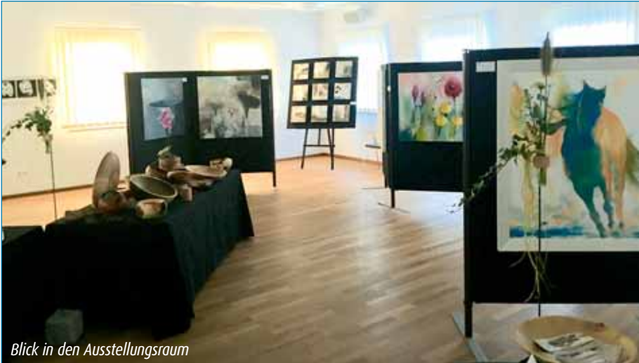
Blick in den Ausstellungsraum