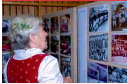
Bei der Ausstellung wurden Erinnerungen wach

sehr viel Interesse bemühten sich die Teilnehmer die gestellten Fragen aus den Informationen der Ausstellung zu beantworten und einen vollständig und richtig ausgefüllten Fragebogen abzugeben. Dabei bildeten sich Trauben von gestikulierenden und auf die Bilder deutenden Leuten, die sich oder den ein oder anderen alten Bekannten in der Ausstellung dort wiederfanden. Ein herrlicher Anblick, der die Organisatoren für viel Mühe und Zeit entlohnte.