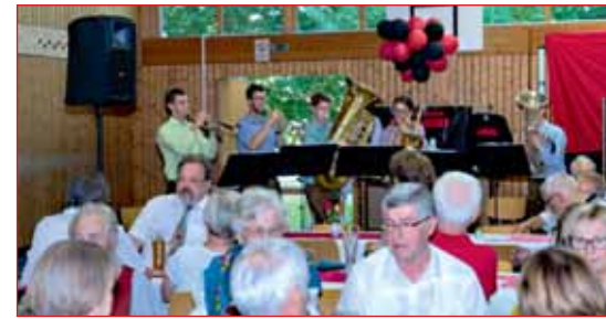
Musikalischer Rahmen mit den »Fegerspezies«

Am darauffolgenden Samstag schloss sich das traditionelle Waldfest an, wo bei herrlichem Wetter die Turniere und Aktivitäten der einzelnen Abteilungen das Sportgelände in einen Bewegungspark verwandelte, ob bei den