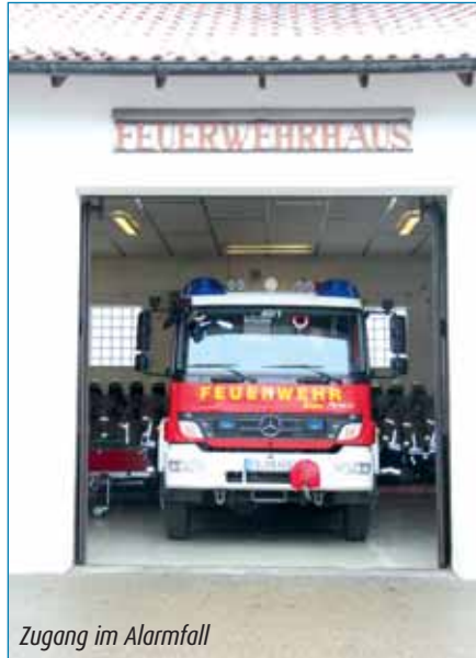
Zugang im Alarmfall

3 Der Zugang zum Feuerwehrhaus sollte über einen separaten Zugang erfolgen um »gefährliche Begegnungen« mit ausfahrenden Feuerwehrfahrzeugen zu vermeiden. Diese Sicherheitsmaßnahme ist bei der Zugang im Einsatzfall nur über die »Halbentore« stattfindet.