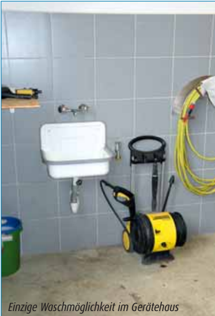
Einzige Waschmöglichkeit im Gerätehaus

was zu einer Verschleppung von gesundheitsschädlichen Stoffen und Verschmutzung des privaten PKWs sowie im weiteren der eigenen Wohnung, zur Folge haben kann.