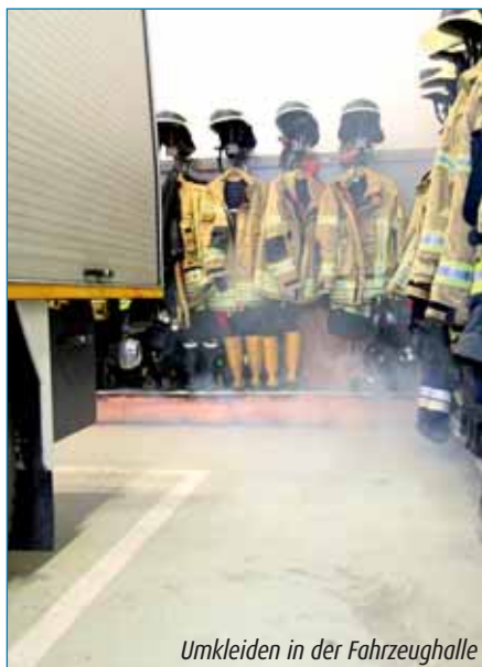
Umkleiden in der Fahrzeughalle

Eine Absaugung ist insbesondere dann erforderlich, wenn in der Fahrzeughalle die persönliche Schutzkleidung und die priva-