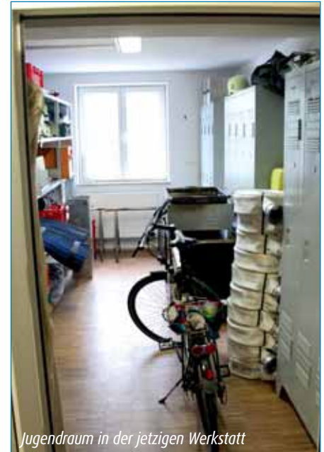
Jugendraum in der jetzigen Werkstatt

Die Angehörigen der freiwilligen Feuerwehr (als kommunaler Bestandteil der Gemeinde