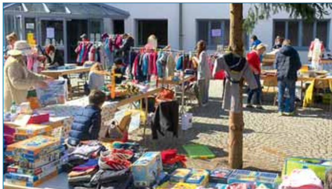
Verkäufer bei der Vorbereitung, 1 Stunde vor Beginn des Flohmarktes.

Am 17. März 2019 fand unser diesjähriger Flohmarkt außerplanmäßig draußen vor der Gemeindehalle auf dem Schulhof statt.