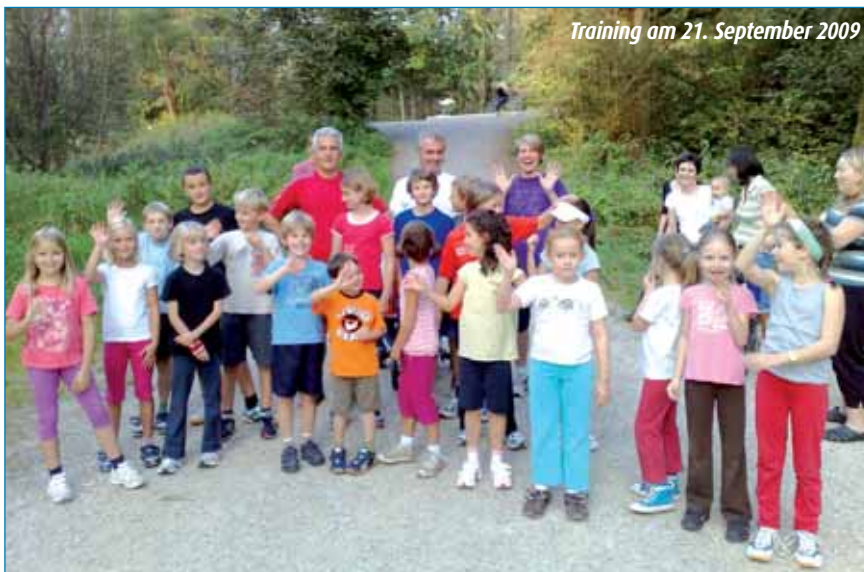
Training am 21. September 2009

nicht schlecht, als da nahezu nicht enden wollende Läuferschar an ihnen vorbei zog. Bei jeder Runde durch den Angerweg wurden alle Läufer zudem durch die hervorragend aufspielende Sambaband „Safado“ unterstützt. Ein Service, der sonst nur bei größeren Läufen zu finden ist und in Marzling zu Bestleistungen motivierte, da gerade an dieser taktisch wich-