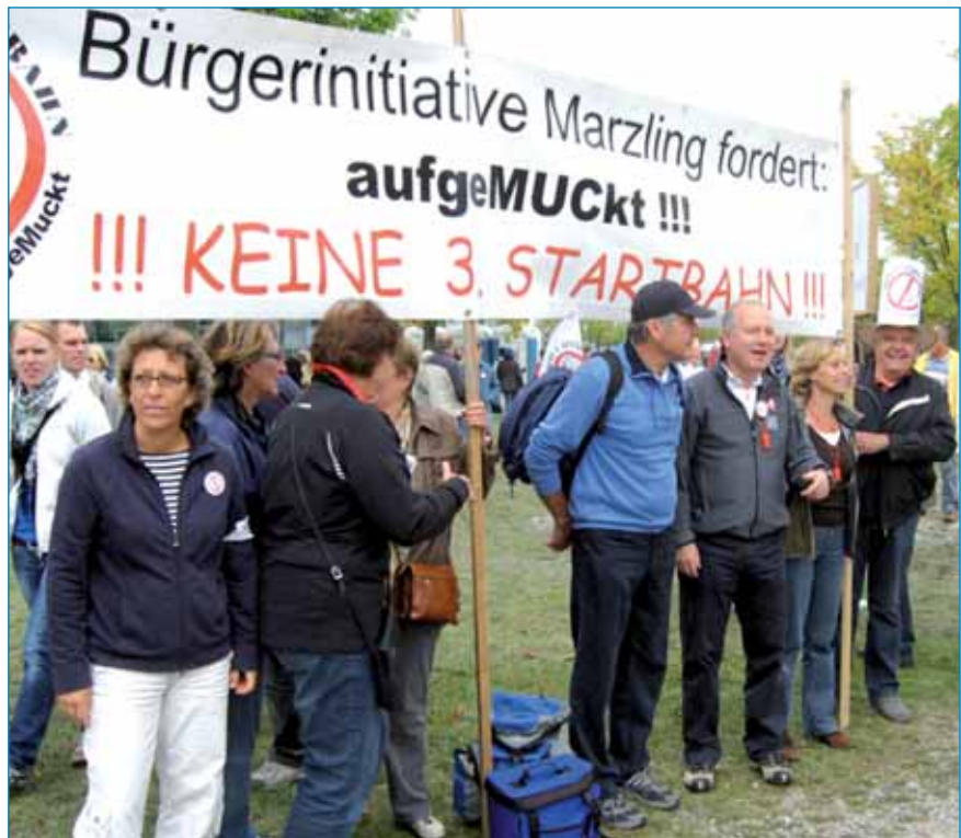
Die BI Marzling bei Demo vor dem FMG Gebäude am 12. September 2009

Die schon zu Wiesheu's Zeiten totgeglaubte Marzlinger Spange (MS) lebt noch immer; als Variante 11 wird sie im Rahmen des Planungsverfahrens für eine Schienenanbindung des Flughafens untersucht. Bei einem Besuch der BIM im Wirtschaftsministerium Ende Juli wurde uns der damalige Planungsstand vorgetragen. In dieser ersten Phase der noch andauernden standardisierten Planungsphase erhielt die MS eher eine ungünstigere Bewertung der Kosten-Nutzen Analyse (hier werden die Kosten den zu erwartenden Verkehrsströmen gegenübergestellt), gegenüber anderen Alternativen (z.B. der Neufahrner Kurve). Die Ergebnisse der derzeit durchgeführten zweiten Planungsphase für alle Varianten der Schienenanbindung sollen Ende November 2009 vorgestellt werden. Wenn die ungünstige Kosten-Nutzen Analyse für die MS darin bestätigt wird dürfte diese Variante wohl endgültig vom Tisch sein und nicht mehr weiter untersucht werden. Aber, die letz-