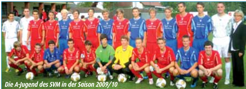
Die A-Jugend des SVM in der Saison 2009/10

Auf einem sehr erfreulichen dritten Platz beendete die letztjährige B-Jugend ihre erste Kreisklassen-Spielzeit nach dem Aufstieg im Sommer 2008. Die Mannschaft wechselte nahezu komplett in den A-Jugend-Bereich und hat sich zum Ziel gesetzt, am Ende dieser Saison als Meister den Aufstieg in die Kreisklasse zu realisieren.