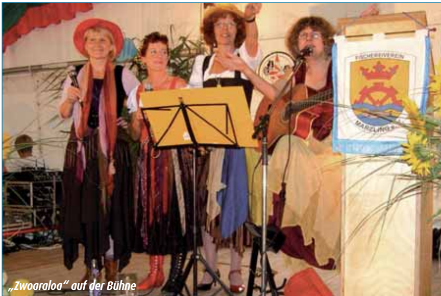
„Zwoaraloo“ auf der Bühne