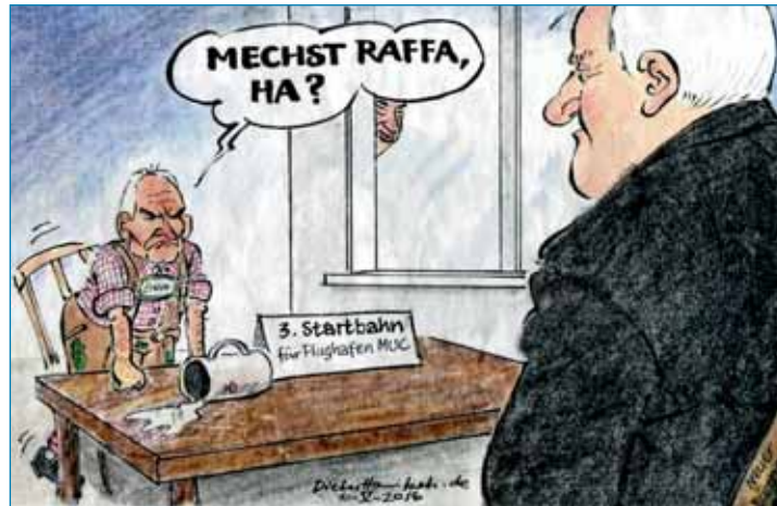
© Süddeutsche Zeitung vom 10. Mai 2016, Hanitzsch Huber

Lauf Finanzministerium hat die FMG in den vergangenen Jahren über 200 Millionen Euro Zuschüsse für neue Fluglinien gezahlt. Das meiste Geld ging in den Jahren 2005 bis