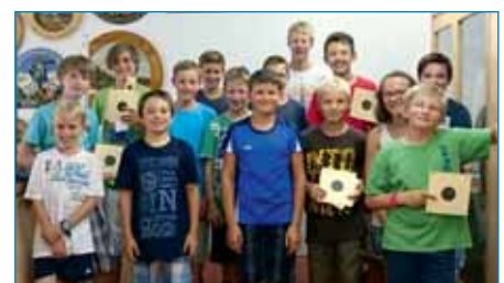
Aktive Jugendförderung beim Marzlinger Ferienprogramm 2015.

Unser Jubiläum Ende Juli in Hangenham rückt näher, und die Vorfreude steigt. Für das leibliche Wohl ist bestens gesorgt, und wir freuen uns auf zahlreiche Besucher, die mit uns feiern wollen.