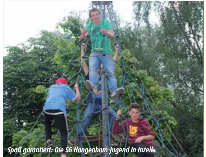
Spaß garantiert: Die SG Hangenham-Jugend in Inzell

Das stellte aber für die sechs Teams kein Problem dar und so konnten bald alle »in den Weiher stechen«. Von der ausgelassenen Floßfahrt bekamen unsere jungen Seeleute richtigen Hunger, dem wir aber mit gegrillter Seemannskost Abhilfe schaffen konnten. Alle waren begeistert und so werden wir auch 2015 wieder Floßfahren.