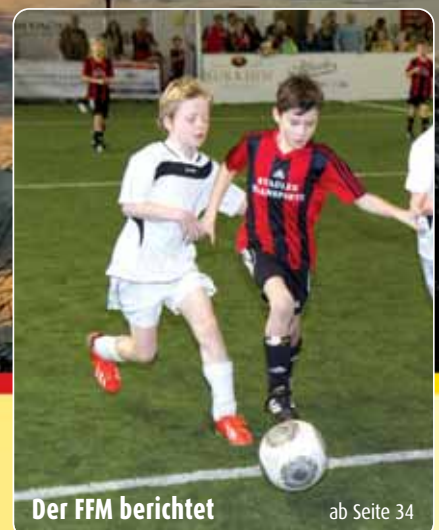
Der FFM berichtet ab Seite 34