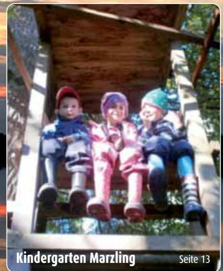
Kindergarten Marzling Seite 13