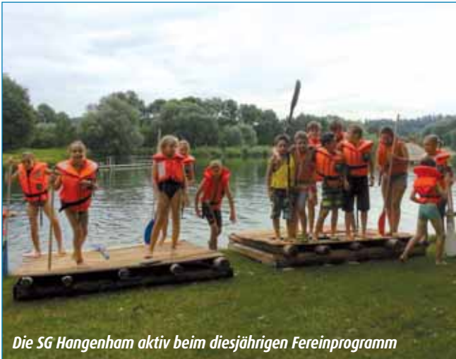
Die SG Hangenham aktiv beim diesjährigen Ferienprogramm

Das zeigte sich deutlich beim Ferienprogramm. Mit 30 Marzlinger Kindern fuhren wir zum Haager Weiher, um mit Hammer und Nagel bewaffnet, Flöße zu bauen. Beim Montieren war nicht nur Geschicklichkeit, sondern auch Kraft gefragt.