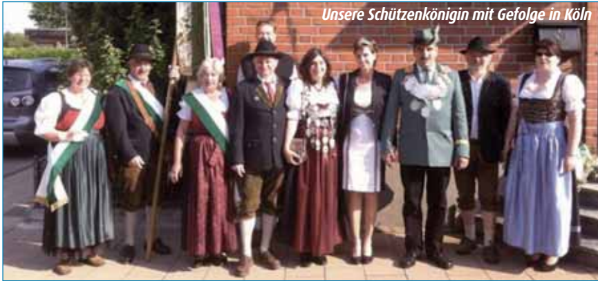
Unsere Schützenkönigin mit Gefolge in Köln

bayernliga, SGI Waldkraiburg, mit 3:2 besiegen. Unserer 2. Mannschaft gelang der Aufstieg in die Gauoberliga. Die 3. Mannschaft schaffte den Klassenerhalt in der Gauklasse A. Auch unsere Luftpistolenmannschaft kann sich schon seit etlichen Jahren in der Gauoberliga beweisen.