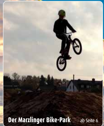
Der Marzlinger Bike-Park ab Seite 6

Auflage: 1.500 Exemplare kostenlos in jedem Haushalt